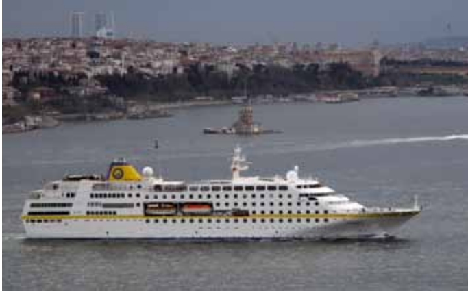
Im Winter 2015/16 steuert die MS Hamburg erstmals Asien an

Mit immer wieder neuen Urlaubsideen überrascht Plantours Kreuzfahrten alljährlich die Kreuzfahrtszene. So sind auch im neuen Fahrplan wieder neue Destinationen neben den Klassikern an der Nordsee und