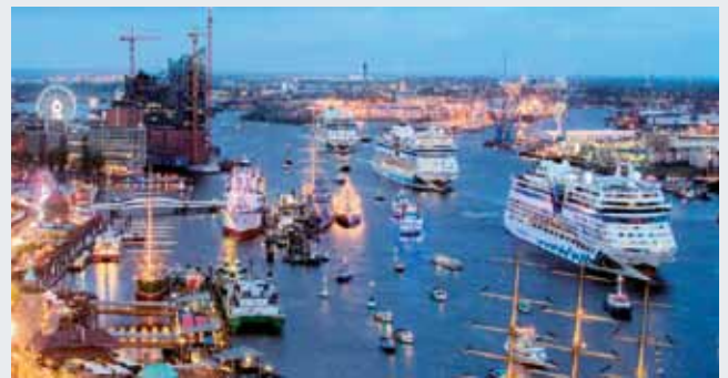
Die AIDAmar beim Hamburger Hafengeburtstag

Die aktuelle Analyse der CLIA (Internationaler Verband der Kreuzfahrtunternehmen) belegt eindrucksvoll, dass sich der Kreuzfahrtboom weltweit mit neuem Passagierrekord für 2014 fortgesetzt hat. Dabei verbrachten 2014 fünf von zehn Gästen aus Kontinentaleuropa ihren Urlaub an Bord eines Kreuzfahrtschiffes der Costa Gruppe. Deutschland ist laut der neuen CLIA-Studie Marktführer in Europa und, hinter den USA, die Nummer zwei auf dem Kreuzfahrtmarkt weltweit. Mit den Marken AIDA und Costa ist die Costa Gruppe in Deutschland klarer Marktführer: Deutsche Passagiere buchten jede zweite Kreuzfahrt bei den Marken der Costa Gruppe. Die 25 Schiffe der Marken Costa Crociere, AIDA Cruises und Costa Asia verfügen über eine Gesamtkapazität von 68.000 Betten. Zwei weitere Neubauten mit insgesamt 8.700 Betten werden bis 2016 die Flotte verstärken.