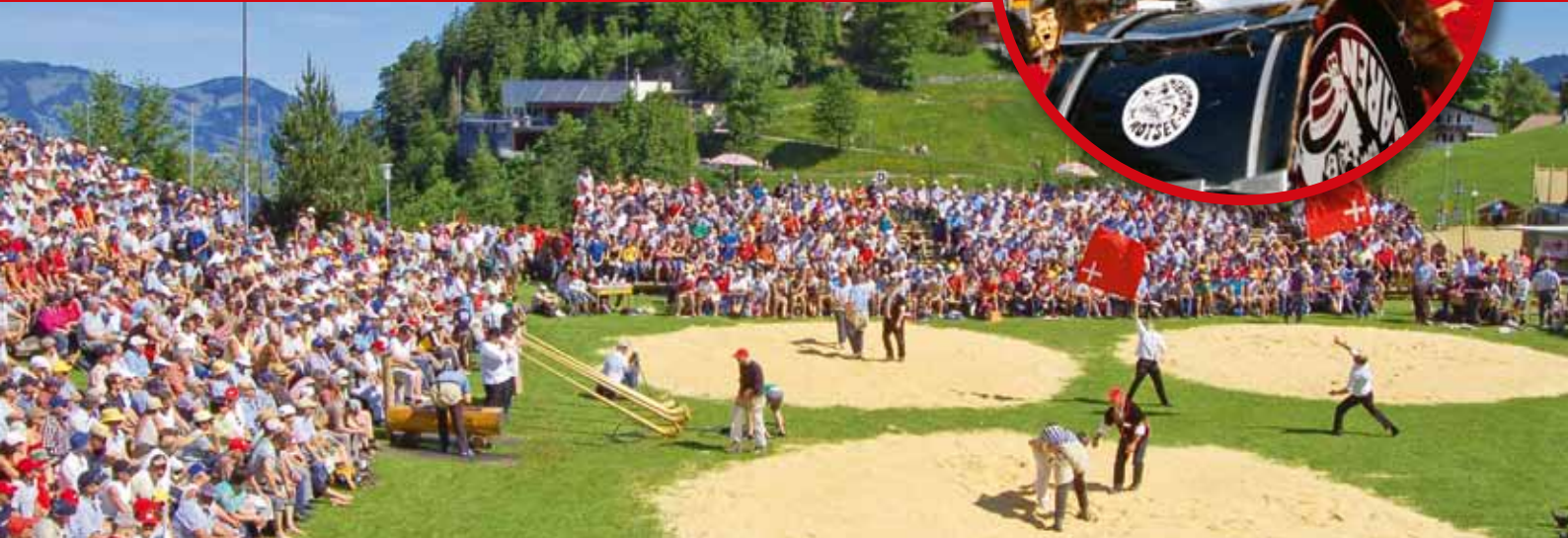
Im Sommer feiern die Schwinger, Äpler und Sennen mit Alpaufzügen, Fahنشwingen, Jodelvorträgen und Alphornbläsern wie hier in Stoos

Tradition und Brauchtum sind wichtige Bestandteile der Region Luzern-Vierwaldstättersee. Feste und Schaubetriebe eignen sich gut für Gruppen.