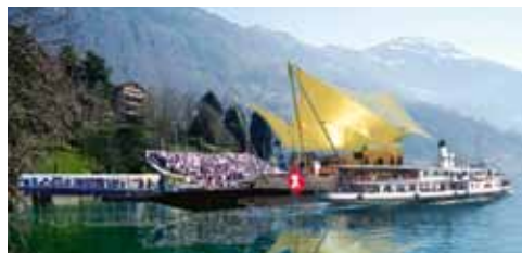
So könnte die schwimmende Event-Bühne aussehen

weise die Tourismusregion Klewenalp ein Wochenende der offenen Stalltüren, an welchem Bauern den Gästen Lebensweise und Herausforderungen von Äpler und Bauern zeigen und sie dazu einladen, selber anzupacken. Der Seelisberg Tourismus initiiert ein Brauchtumswochenende, das eine nachhaltige Verbindung zwischen Gästen und Einheimischen schaffen soll. Zudem wird Wetz eine Ausstellung mit 30 Künstlern speziell zum Thema Gastfreundschaft konzipieren.