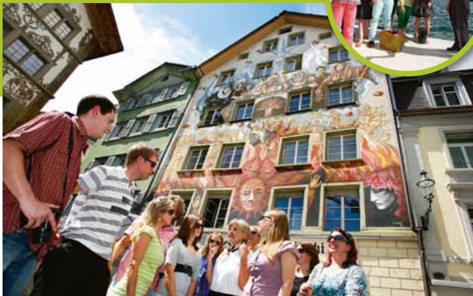
Luzern-Neulinge ebenso wie Kenner der Lichterstadt können bei den Stadtführungen Neues entdecken

Luzern erkundet man als Besucher am besten auf einem geführten Stadtrundgang. Neben dem klassischen Stadtbummel bietet Luzern Tourismus auch eine große Auswahl an thematischen Stadtführungen an.