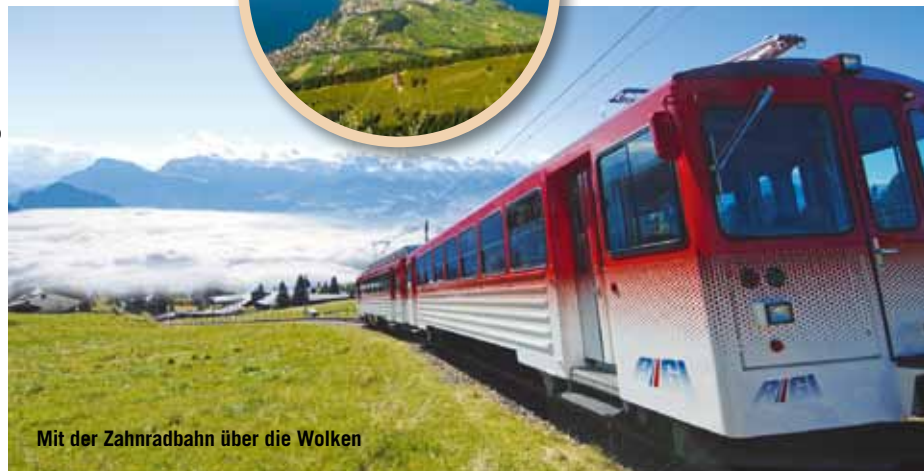
Mit der Zahnradbahn über die Wolken

Top-Location für spezielle Events. Das multifunktionale, beheizbare Eventzelt der Rigi Bahnen AG auf Rigi Staffel – umrahmt von majestätischen Gebirgszügen und Aussicht auf die unverwechselbare Natur der Rigi – ist vielseitig und flexibel nutzbar. Es kann ganzjährig gemietet werden und bietet Platz für 100 bis maximal 750 Personen. Das Event-Team der Rigi Bahnen gibt gerne Auskunft über Konditionen und Preise.