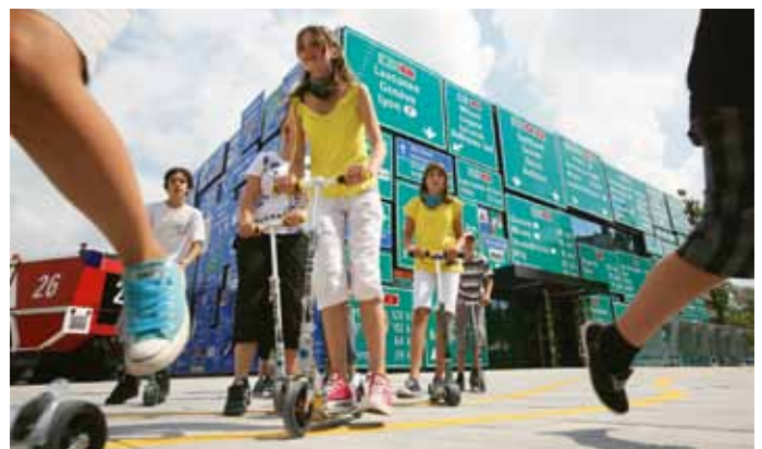
Verkehrsmittel aller Art sind Thema im Verkehrshaus der Schweiz