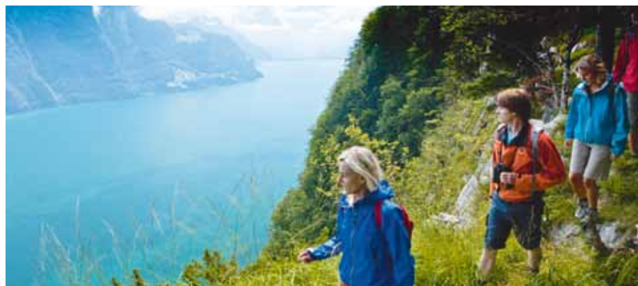
Die Rundtour um den Vierwaldstättersee führt manchmal hoch hinaus, manchmal direkt am Ufer entlang

Touren für alle Ansprüche und Fitnessgrade stehen zur Auswahl