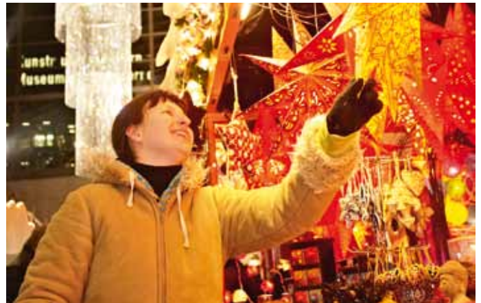
Weihnachtsmarktbummel vor Wind und Wetter geschützt im Bahnhof Luzern

Vor Wind und Wetter geschützt, kann man sich im Bahnhof Luzern in Weihnachtsstimmung bringen. Zum elften Mal laden rund 50 Markthäuser und die Engelsstimmen-Bühne auf dem Christkindlimarkt ein, die schöne Vorweihnachtszeit zu genießen. Von Kunsthandwerk über schöne Stoffwaren bis zu Dekorationen und Accessoires findet sich eine Vielzahl origineller Geschenkideen. Auf der Engelsstimmen-Bühne präsentieren Musikerinnen und Musiker unterschiedlichster Stilrichtungen vor großer Wolkenkulisse ihr weihnachtliches Programm. Dass das Emmental nicht nur mit seinem berühmten Käse begeistern kann, erleben die Besucherinnen und Besucher im Emmentaler Stöckli. Im Angebot sind die typischen regionalen Spezialitäten wie Käse, Wurst, Kräutertee und gebrannte Wasser. Bekannt ist das Emmental auch für sein Kunsthandwerk. Bei verschiedenen Handwerksvorführungen können Interessierte bei Holzbildhauerei, Seifensiederei, Spycherhandwerk und Co. den Künstlern über die Schulter schauen.