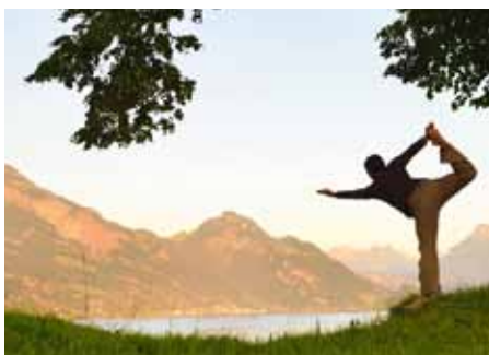
Beim Yoga vor Bergkulisse schöpft die Seele Kraft