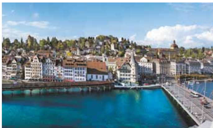
Die Ursprünge der Stadt Luzern reichen bis ins 12. Jahrhundert zurück