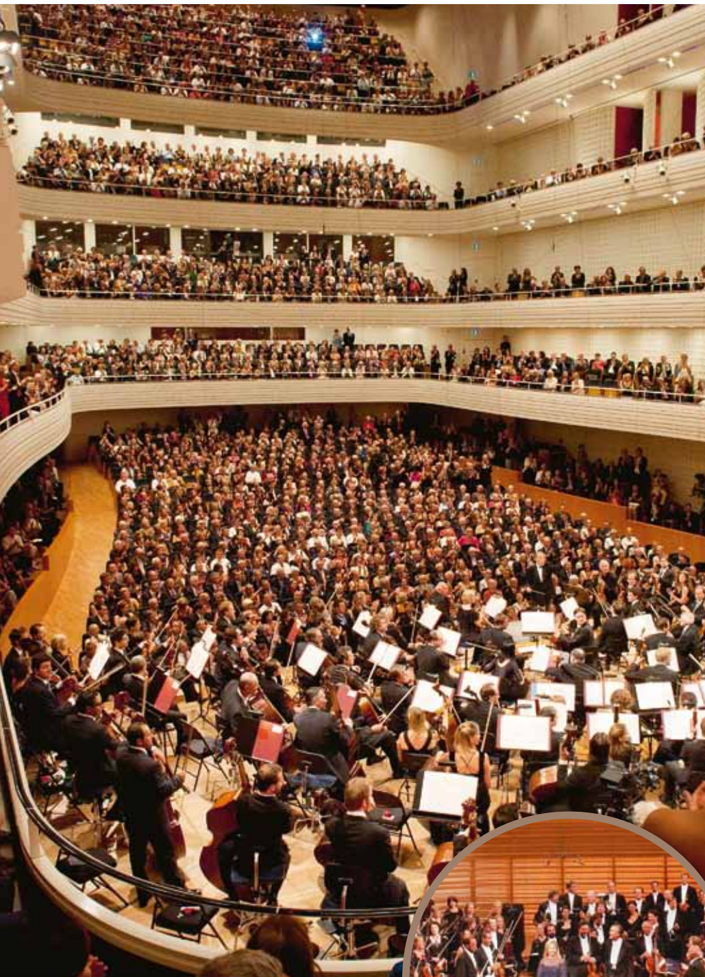
Top-Musiker und Dirigenten beim Lucerne Festival

... rund ums Jahr: Die Festivals in Luzern locken jedes Jahr viele Spitzen-Musiker und mehrere Hunderttausend Liebhaber von Klassik bis Jazz aus aller Welt an den Vierwaldstättersee.