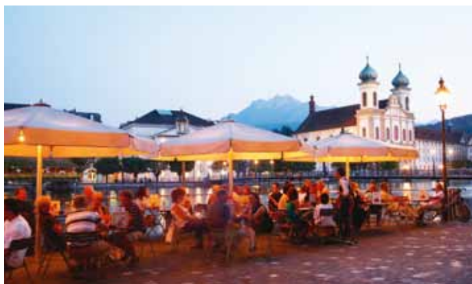
In der Altstadt am Ufer der Reuss liegt die Jesuitenkirche St. Franz Xaver