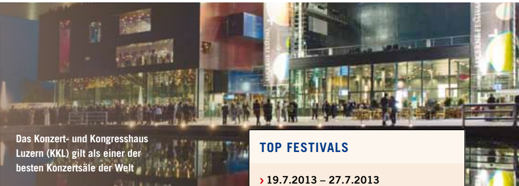
Das Konzert- und Kongresshaus Luzern (KKL) gilt als einer der besten Konzertsäle der Welt

Wer den Vierwaldstättersee im Frühjahr kennenlernen möchte, mit Blick auf die vielleicht noch schneebedeckten Berge nach einem genussvollen Kulturerlebnis sucht, kommt genau richtig zu Lucerne