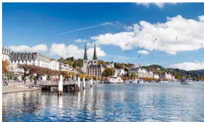
Die Quais laden zum Flanieren am Vierwaldstättersee ein