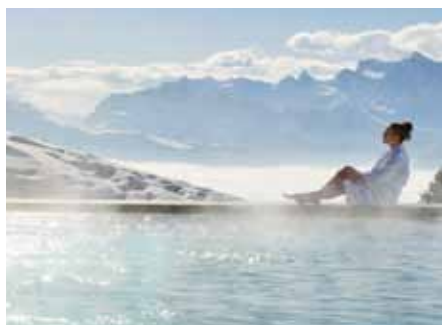
Erholung für Körper und Geist im Rigi Mineralbad