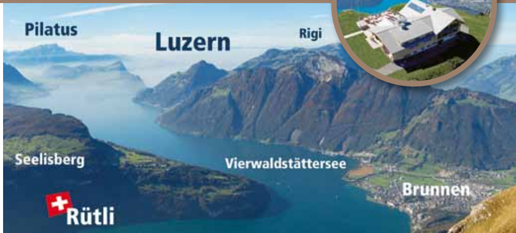
Zehn Seen, unzählige Berggipfel und hinunter zum Rütli kann man vom Fronalpstockgipfel aus sehen

Württemberg, Bayern, Vorarlberg und Tirol für einen wunderbaren Ein- oder Mehrtagesausflug in die Schwyzer Berge. Zusammen mit den attraktiven Preisen bietet der Stoos ein unschlagbares Paket. Busgruppen erhalten die Bergbahn-Tageskarte zum Gipfel bereits für 18 Euro pro Person, Busfahrer und Reiseleiter sind frei.