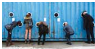
In 40 Containern erwarten Besucher Geschichte und Geschichten

Im Zentrum der Sonderausstellung stehen rund 40 Container in verschiedenen Varianten, Logistikgeräte und Transporter. Die Container dienen als Ausstellungs- und Interaktionsräume, in denen Transportketten sichtbar werden und Logistik greifbar wird. Die Besucher erwarten authentische und