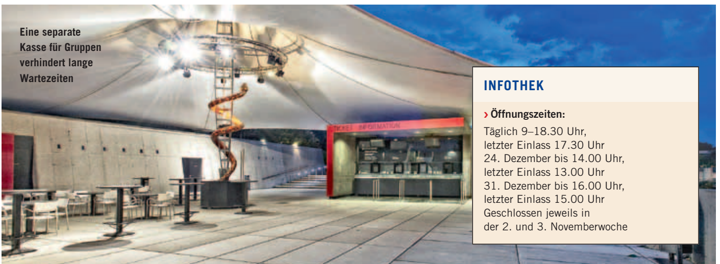
Eine separate Kasse für Gruppen verhindert lange Wartezeiten

Neuigkeiten. Den Riesen erlebt man nie zweimal auf die gleiche Art! Der Multimediakünstler André Heller, der die Swarovski Kristallwelten 1995 anlässlich des