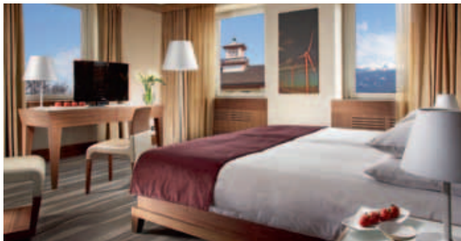
Das Grand Hotel Europa setzt auf warme Farben und hochwertige Materialien

Innsbrucks einziges Fünf-Sterne-Haus ist seit 1869 ein Ort echter Gastfreundschaft im Herzen der Stadt Innsbruck. Alle 106 Zimmer und Suiten wurden im Jahr 2010 vollständig renoviert und überzeugen mit klaren Linien und höchstem technischen Komfort. War-