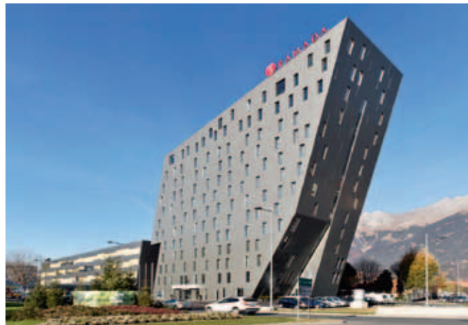
Moderne Herberge mit Bergpanorama: das Ramada Tivoli Innsbruck

Wer über Nacht in Innsbruck bleiben möchte, hat zahlreiche Hotels für jeden Geschmack zur Auswahl. Als eines der modernsten eröffnete das Ramada