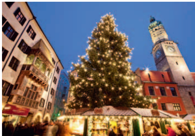
Fünf Christkindlmärkte in Innsbruck verbreiten Weihnachtsstimmung