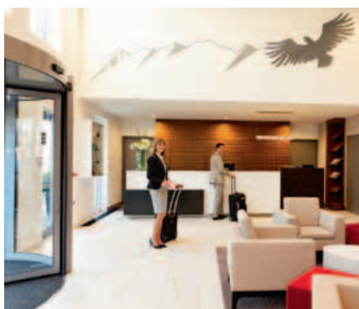
Direkt gegenüber den Sportstätten der Olympia World in Innsbruck liegt das Hotel Ramada Innsbruck Tivoli