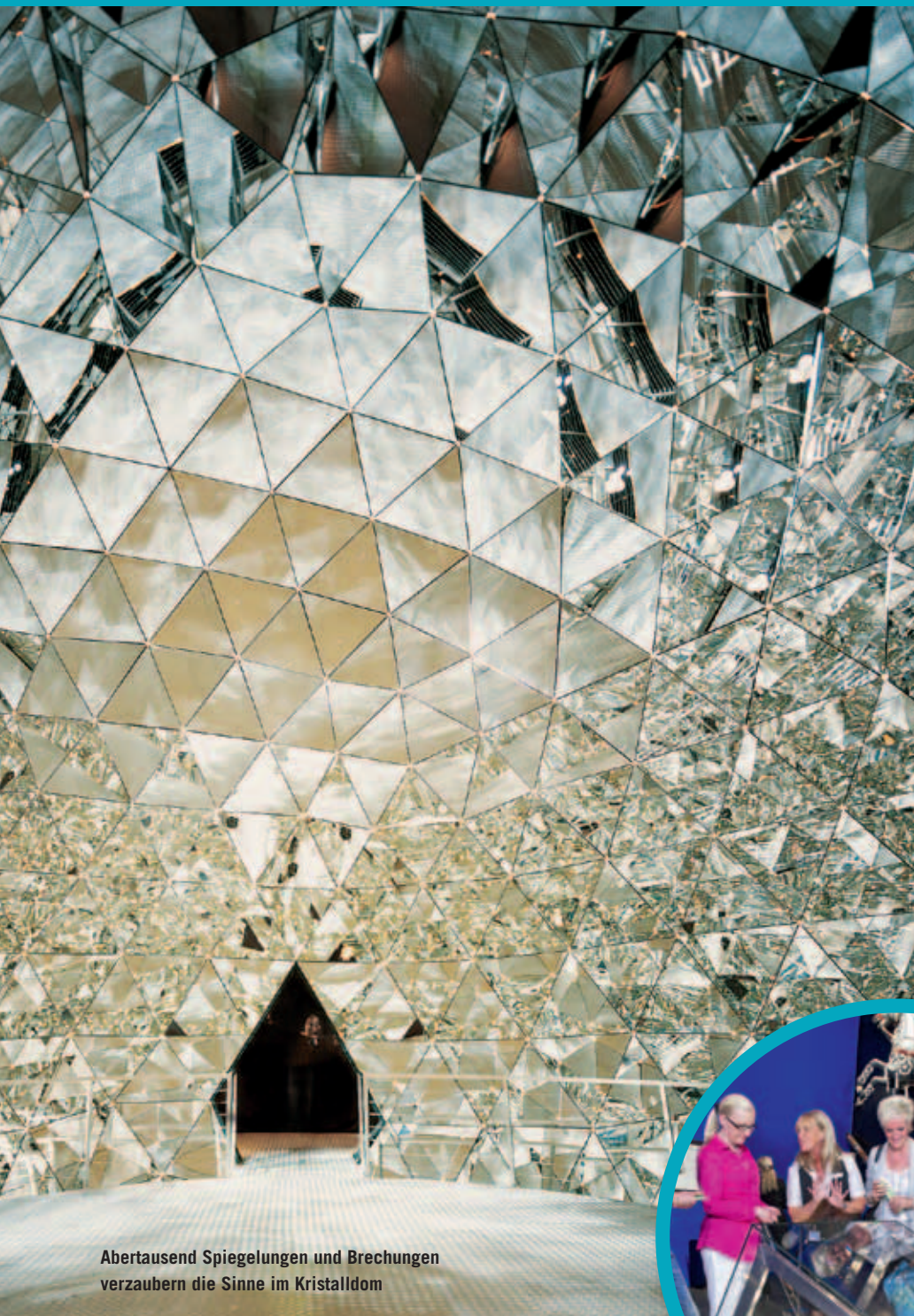
Abertausend Spiegelungen und Brechungen verzaubern die Sinne im Kristalldom

Seit der Eröffnung 1995 haben mehr als elf Millionen Menschen die Swarovski Kristallwelten besucht. Das macht die kristalline Fantasiewelt zur meistbesuchten Sehenswürdigkeit Tirols.