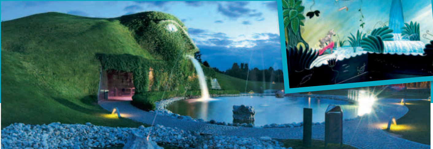
Der Riese hat sich zu einem Markenzeichen Tirols entwickelt. Mehr als 650.000 Menschen kommen jedes Jahr hierher, um sich verzaubern zu lassen

sind die Swarovski Kristallwelten bestens auf Gruppen vorbereitet und bieten ihnen jeglichen Komfort: Kostenlose Busparkplätze sind ausreichend vorhanden, eine eigene Gruppenkasse verhindert lange Wartezeiten und erleichtert dem Busfahrer die Abwicklung vor Ort. Sanitäranlagen befinden sich direkt im Eingangsbereich sowie an einigen weiteren Punkten der Ausstellung.