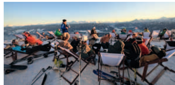
... wie Speisen und Getränke in Lounge-Atmosphäre

Parken in der Congress oder Citygarage. Für Erwachsene kostet das Kombiticket Alpenzoo 11,00 Euro pro Person, für Jugendliche und Senioren 9,00 Euro. Kinder ab sechs Jahren zahlen 5,50 Euro, Kinder zwischen vier und fünf Jahren zahlen 2,00 Euro Eintritt.