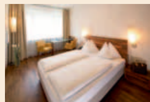
98 moderne Zimmer und zwei Suiten beherbergt das Penz Hotel

P Penz Hotel West Fürstenweg 183 6020 Innsbruck Tel. +43 (0) 5 12 / 2 25 14 office@penz-west.at www.penz-west.at