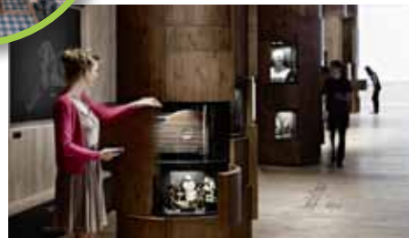
Für fünf Tiroler Landesmuseen gibt es ein Ticket