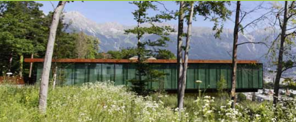
Das Tirol Panorama mit Kaiserjägermuseum zeigt das Land Tirol in all seinen Facetten

Das Tirol Panorama mit Kaiserjägermuseum ist Tirols jüngstes Museum . Das neue Haus am Bergisel schickt seine Besucherinnen und Besucher auf eine spannende Zeitreise durch bedeutende Stationen der Geschichte Tirols.