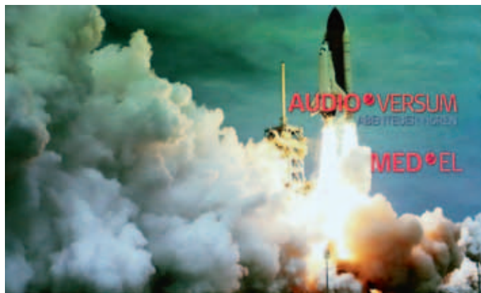
Das Audiversum Innsbruck entführt in die spannende Welt der Akustik.

lebnisse und faszinierende akustische Landschaften versprechen, die Besucher auf eine aufregende Reise in die Welt der Akustik zu entführen. www.audiversum.at