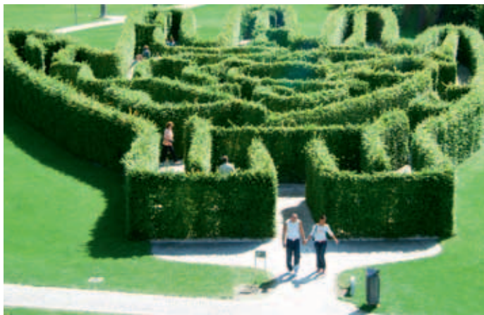
Der Großteil der Investitionen soll in Attraktionen im Außenbereich fließen