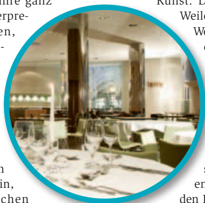
Kulinarische Pause vom Kunst- und Kristallgenuss im CAFÉ-terra

Immer neue beeindruckende Impulse werden mit dem Programm „Kunst im Riesen“ gesetzt, in dessen Rahmen sich die Wunderkammern immer wieder in eine Bühne für neue überraschende Ausstellungen verwandeln. Seit 28. September 2012 präsentiert sich einer der Ausstellungsräume unter dem Titel „Transparente Opazität“ im neuen