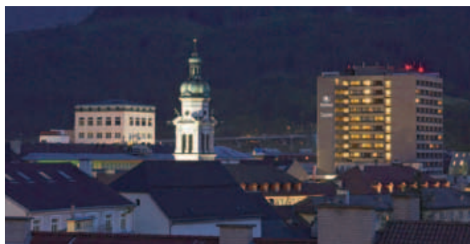
Große Zimmer und kurze Entfernungen zur Altstadt bietet das Hilton Innsbruck

H Hilton Innsbruck Salurner Straße 15 6010 Innsbruck Tel. +43 (0) 5 12 / 59 35 22 11 innsbruck.events@hilton.com