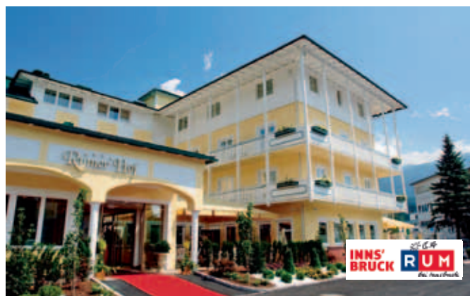
Gruppentauglich: Der Rumer Hof bietet 140 Betten und 500 Restaurantplätze

Der Rumer Hof bietet eine gelungene Kombination aus Tradition und Moderne. In dem komplett renovierten Vier-Sterne-Hotel trifft geschmackvolles Ambiente auf zeitgemäße Ausstattung. Verkehrsgünstig gelegen bietet es einen guten Ausgangspunkt in die nur fünf Kilometer entfernten Städte Innsbruck und Hall. Die Zimmer mit insgesamt 140 Betten verfügen über Sat-TV, gratis WLAN, Radio, Telefon und teilweise Balkon. In dem