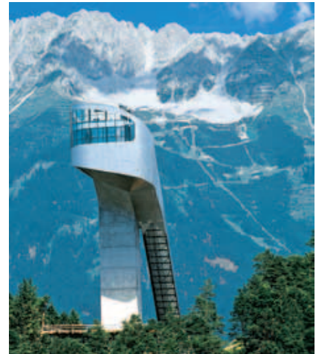
Die Bergisel Schanze, Teil der Vierschanzentournee