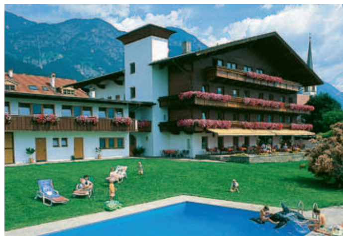
55 Betten hat der Huberhof, fünf Kilometer von Innsbruck entfernt

f Familie Huber St.Georg-Weg 6 6063 Rum Tel. +43 (0) 5 12 / 26 12 20 Fax +43 (0) 5 12 / 2 61 22 05 info@hotel-huberhof.at www.hotel-huberhof.at