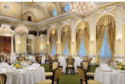
Beeindruckend: der Barocksaal

f Grand Hotel Europa Südtiroler Platz 2A, 6020 Innsbruck www.grandhoteleuropa.at