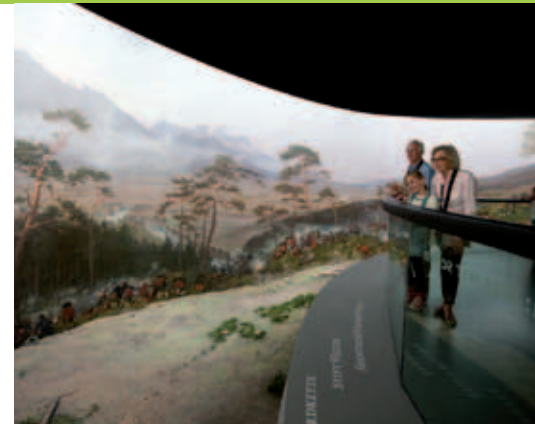
Herzstück des Museums ist das 360-Grad-Gemälde

M it dem Tirol Panorama hat der Bergisel seit März 2011 eine gelungene architektonische Attraktion und die Stadt Innsbruck ein touristisches Highlight. Das Museum zählt zu den Top-Ausflugszielen Österreichs, an dem das Land Tirol entdeckt und erlebt werden kann – in all seiner Widersprüchlichkeit und Faszination.