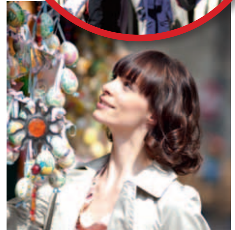
Dekoratives zu Ostern auf dem Innsbrucker Markt