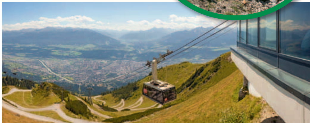
Bis auf 2.256 Meter Höhe führen die Innsbrucker Nordkettenbahnen

Die Alpenlounge Seegrube in der Bergstation auf der Seegrube stellt einen Anziehungspunkt für all jene dar, die in gemütlicher Atmosphäre Drinks und Speisen genießen wollen – spektakulärer Tiefblick über Innsbruck inklusive. Im ersten Stock