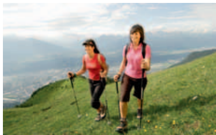
Auf der Seegrube lockt das Naturerlebnis ebenso ...

lädt eine großzügige Sonnenterrasse zum Verweilen ein.