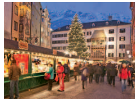
Fünf Christkindlmärkte verbreiten Adventstimmung