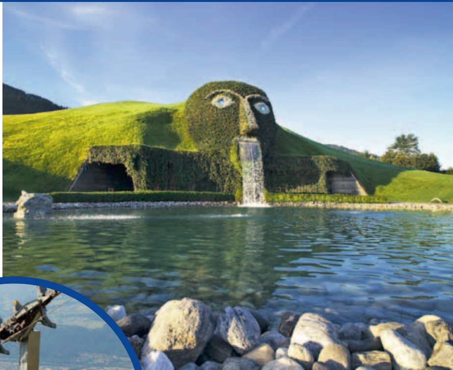
Die Swarovski Kristallwelten bieten ihren Besuchern eine glitzernde Fantasiewelt im Bauch des Riesen

Magie im Winter. Im Winter und besonders rund um Weihnachten verzaubert der Panoramachristkindlmarkt, den man auf dem Weg zur Seegrube besuchen kann, mit einem festlichen Ambiente und magischen Ausblicken auf die Lichter der Alpenhauptstadt. In seinen Bann zieht die Gäste aus aller Welt auch die Lichtinstallation „Wintergarten“, die den Riesen in Wattens mit tausenden von Lichtern stimmungsvoll erstrahlen lässt.