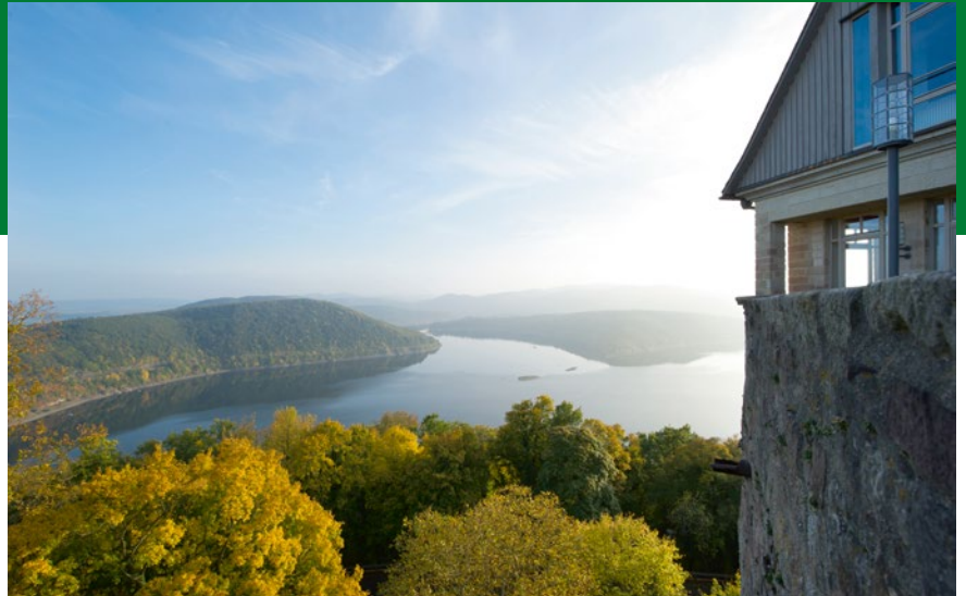
Zahlreiche Freizeit- und Outdoor-Möglichkeiten bietet Nordhessen, die Heimat der Brüder Grimm