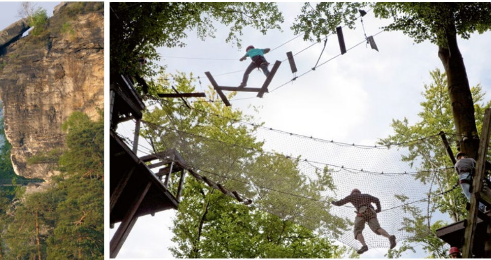
Ob Gruppen, Vereine oder Unternehmen – im Klettergarten kommen alle auf ihre Kosten

Vollkuppelshow bis zum Weltraumflug. Ein virtuelles Abenteuer auf 230 Quadratmetern „gewölbter Leinwand“. Vielfältige Veranstaltungen wie das Gartenbahntreffen im April (29./30.) und September (23./24.) oder die „Miniwelt bei