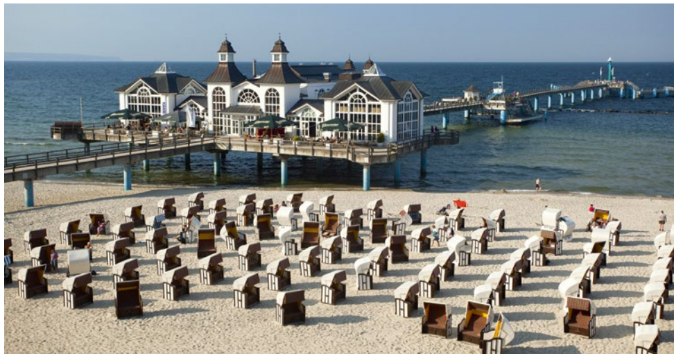
Auf Rügen wird mit dem Festspielfrühling das Wiedererwachen der Natur nach dem Winter eingeläutet

und „Kleider machen Leute“ aufgeführt. Zudem finden im Jahresverlauf die „Kreuzgangspiele extra“ und die „Kreuzgangspiele klassik“ statt, die ihren thematischen Schwerpunkt auf klassische Kunst legen.