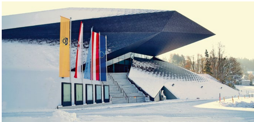
Das Festspielhaus Erl geht in sein 7. Jahr, voraussichtlich ein verflixt gutes. Wegen der perfekten Akustik wird es von Publikum und Kritikern geschätzt

D as Festspielhaus Erl wurde 2012 feierlich eingeweiht. Sechs gute Jahre liegen hinter den Tiroler Festspielen Erl, die 7. Festspielsaison steht an. Die Tiroler Festspiele Erl haben ihren Ruf als Heimat für Belcanto gefestigt, ein Erfolg, der nicht nur den Fertigkeiten von Dirigent, Orchester und Chor, sondern zweifelsohne auch der perfekten Akustik des neuen Festspielhauses zu verdanken