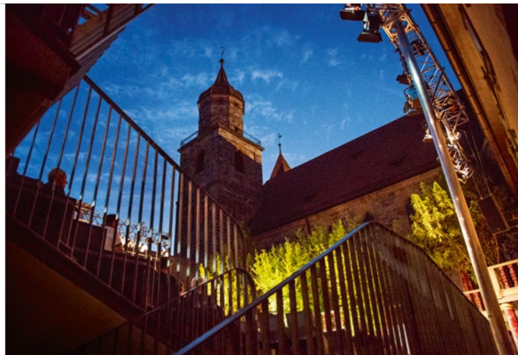
Besondere Atmosphäre bei den Kreuzgangspielen in Feuchtwangen

variieren. Beispielsweise kann die Gruppenführung „Blühendes Leben“ mit einer Teilnehmeranzahl von maximal 30 Personen im Vorfeld des Besuchs gebucht werden. Wer etwas intensiver in die Materie eindringen möchte, dem seien die Gruppenführungen mit besonderen thematischen Schwerpunkten ans Herz gelegt. Sie können mit der Tourist-Information Heilbronn vereinbart werden. Experten gehen dabei auf spezielle Nachfragen der Teilnehmer ein. Die Dauer einer solchen Führung liegt bei etwa drei Stunden. Busfahrer und Reiseleiter, die eine Gruppe zur Bundesgartenschau nach Heilbronn bringen, dürfen sich über freien Eintritt und Verzehrsfreude freuen. Diese werden bei Befahren des Busparkplatzes ausgegeben.