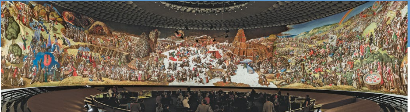
Raumeindruck vom Bildsaal

Gleich zwei Jubiläen werden im Jahr 2019 im Panorama Museum gefeiert.