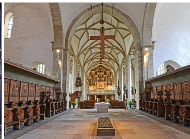
Der Merseburger Dom besitzt mit seiner romantischen Orgel einen besonderen Schatz

artigen klingenden Schatz zu bieten. Die Orgel steht im Mittelpunkt besonderer Konzerte und den jährlich im September stattfindenden Orgeltagen.