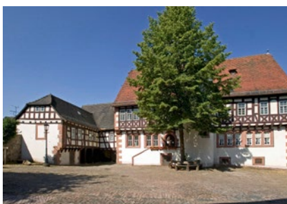
Das Brüder Grimm-Haus Steinau

Im Zentrum der Stadt treffen Sie auf das mächtige Schloss Steinau, das hessenweit besterhaltene Renaissanceschloss.