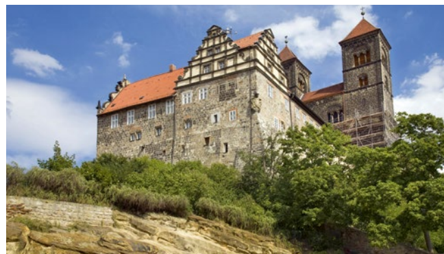
Die Stadt Quedlinburg ist seit dem Jahr 1994 UNESCO-Weltkulturerbe

info@passionsspiele.at | www.passionsspiele.at