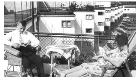
Ausstellung im Deutschen Architekturmuseum

Kaiserdom. Das neue, imposante Dom-Römer-Quartier bietet unter anderem Platz für das Struwwelpetermuseum. Nur einen Sprung von der neuen Altstadt entfernt wird bis 2019 zudem ein moderner Erweiterungstrakt am Jüdischen Museum errichtet.