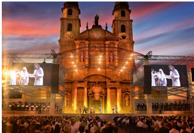
Große Kulisse: Das Bonifatius-Musical ist auf dem Domplatz zu sehen

Anlässlich des bevorstehenden Stadtjubiläums im Jahr 2019 hat sich Fulda etwas Besonderes einfallen lassen. Bereits vor einigen Jahren wurde