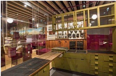
Frankfurter Küche von Margarete Schütte-Lihotzky

Die Metropole Frankfurt am Main ist ein Schauplatz ikonischer Architektur und Ausstellungen. Davon zeugen Museen wie auch die Skyline.