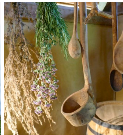
Kochen auf „mittelalterlich“

In Lorsch wird die Vergangenheit nicht nur greifbar, sondern sie wird auch ständig weiter erforscht. Lassen Sie sich in diese Forschungen einbeziehen und in deren Ergebnisse einweihen – wir freuen uns über Ihren Besuch.