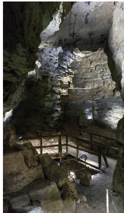
Die Teufelshöhle bei Steinau verdankt ihren Namen dem Aberglauben der Bevölkerung

Genießen Sie weitere Sehenswürdigkeiten, Freizeiteinrichtungen und Veranstaltungen: Theatrum Steinau, Europa-Kletterwald, Stadtführungen, Premiumwanderwege, Märchensonntag, Festival „Steinauer Puppenspieltage“, Katharinenmarkt, Weihnachtsmarkt und die Teufelshöhle.