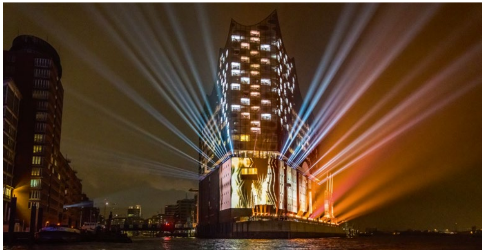
Innerhalb nur eines Jahres mauserte sich die Elbphilharmonie zum Wahrzeichen Hamburgs

Hamburgs Wahrzeichen. Seitdem die Elbphilharmonie im Januar 2017 ihre Pforten öffnete, sind die Konzerte regelmäßig ausverkauft. Massen von Menschen besuchen das Konzerthaus, das sich innerhalb eines Jahres zum echten Wahrzeichen der Stadt an der Elbe entwickelte. Das Programm für die kommende Konzertsaison im Jahr 2019 steht bereits. Karten für die verschiedenen Konzerte können daher schon erworben werden. Schnell sein lohnt sich in diesem Fall allemal. Jedoch nicht nur für Konzerte ist die Elbphilharmonie bestens geeignet. Wer einmal einen einzigartigen Blick über Hamburg genießen möchte, sollte die Plaza des Konzerthauses aufsuchen. Die Plaza gilt als Nahtstelle zwischen dem traditionsreichen Hafenspeicher und dem gläsernen Neubau der Elbphilharmonie und bietet auf 37 Metern Höhe den perfekten Rundumblick auf die Stadt und den Hafen. Einen Blick hinter die Kulissen des Konzerthauses können Besucher bei den „Konzerthausführungen“ werfen. Diese werden tagsüber vor den eigentlichen Konzerten, die meist am Abend stattfinden, angeboten. Neben Details zur Entstehung der Elbphilharmonie und den architektonischen Besonderheiten des Gebäudes gibt die Konzerthausführung