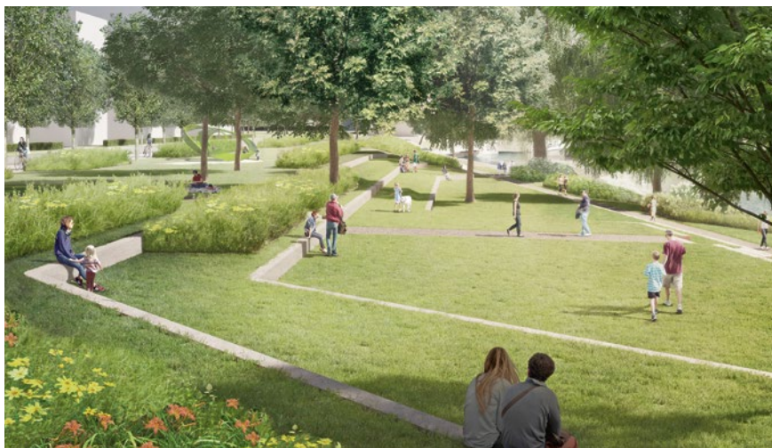
Visualisierungen des Geländes sollen schon heute Lust auf die Buga 2019 machen

musik bis hin zu Schlager. So dürfen sich beispielsweise Klassikfans auf Sere-nadenabende und ein Sommernachtskonzert des Württembergischen Kammerorchesters (WKO) freuen. Und das Theater Heilbronn lädt an insgesamt acht Abenden zum Mozart-Open-Air der Oper „La finta giardiniera“ ein. Für Jazz-Liebhaber werden die Abende mit Nils Landgren und mit Funk Unit sicher zu einem echten Höhepunkt und die SWR Big Band bringt Max Mutzke als Special Guest mit zum Buga-Konzert. Wer hingegen Volksmusik mag, darf sich auf Stefanie Hertel und die Dirndl Rock Band freuen. Auch für die Kleinen ist auf dem großen Areal der Bundesgartenschau 2019 einiges geboten. Neben neu gestalteten Spielplätzen wartet eine Vielzahl an unterschiedlichen Mitmachangeboten und Workshops. Außerdem werden Programme auf dem Schiff „MS experimenta“, Theatervorstellungen und Bühnenshows für Kinder im Laufe des gesamten Jahres angeboten. Für Gruppen bieten die Veranstalter mehrere Führungen an, die in Dauer und Preis