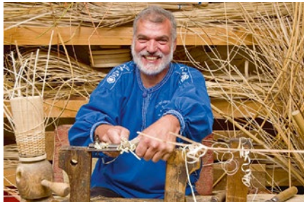
Greifbare Tradition auf der HandwerkErlebnisroute