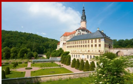
Schloss Weesenstein thronet über dem Müglitztal