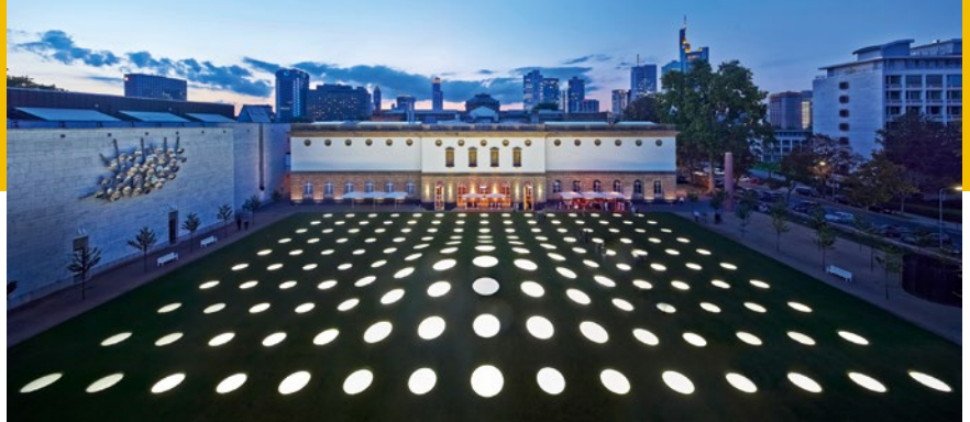
Außenansicht auf das Städel Museum und den Städel Garten

Frankfurt investiert in die attraktive Erweiterung der Museen und in wegweisende Architektur. In nächster Nähe zu Schirn Kunsthalle, Fotografie Forum, Frankfurter Kunstverein und MMK Museum für Moderne Kunst wurde 2017, im Herzen der Mainmetropole am Römerberg, der Neubau des Historischen Museums eröffnet. Neben rekonstruierten historisch fundierte Nachbauten die im Zweiten Weltkrieg zerstörte Altstadt vis-à-vis zum