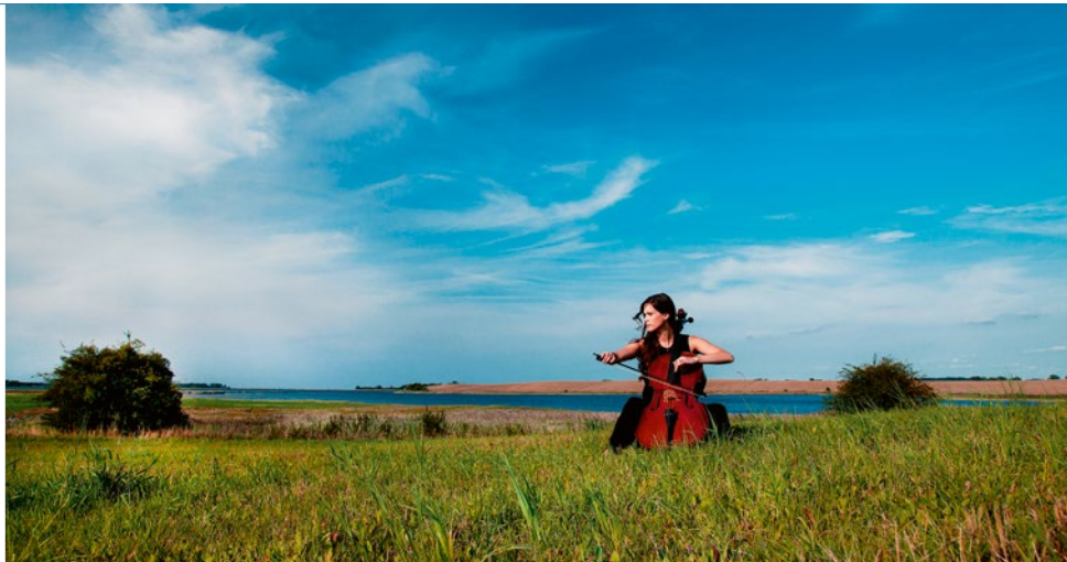
Verschiedene Künstler zeigen während des Veranstaltungsreigens ihr Können am Instrument

Auch die übrigen Konzerte an den folgenden Tagen werden an unterschiedlichen Veranstaltungsorten stattfinden. Neben den Konzerten ergänzen zahlreiche Begleitveranstaltungen den Festspielfrühling. Sie sollen den Besuchern die Natur und die Geschichte der Insel Rügen näherbringen. Am Sonntag, den 7. April 2019, endet der Festspielfrühling Rügen 2019 mit dem schon zur Tradition gewordenen „Festspielkehrhaus“ im Theater Putbus. Der Kartenvorverkauf für den hochkarätigen Event auf Rügen hat bereits begonnen. Karten sind bei der Festspiele Mecklenburg-Vorpommern GmbH oder an allen bekannten Vorverkaufsstellen zu erwerben.