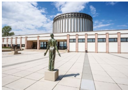
Außenansicht Panorama Museum

Eingetaucht in sakrales Licht umgibt den Betrachter ein monumentales Gemälde, in altmeisterlicher Manier mit faszinierender Plastizität gemalt, das auf den ersten Blick Staunen und Bewunderung, aber auch Verwirrung und Ratlosigkeit auslöst. Eine immense Fülle von mehr als 3.000 Einzelfiguren, jede von unverwechselbarer Individualität in farbenprächtiger Kostümierung, entfaltet sich vor den Augen des Betrachters. Der Blick gleitet durch das Rund und sucht nach einem