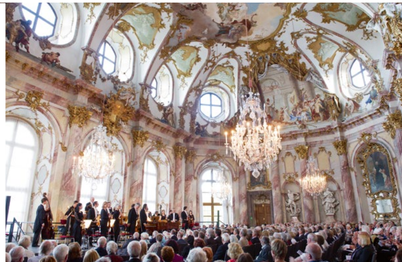
Im Kaisersaal der Würzburger Residenz ist das Klangerlebnis einzigartig