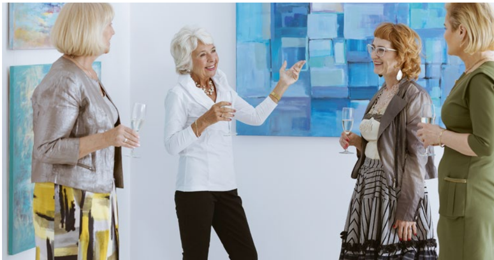
In der Gruppe und im gegenseitigen Austausch machen Ausstellungsbesuche besonders viel Spaß

Römische Lebensweise. „Spot an“! Szenen einer römischen Stadt“ – unter diesem Motto findet vom 31. August 2019 bis zum 26. Januar 2019 eine Sonderausstellung im Rhein Hessischen Landesmuseum in Trier statt. Trier als älteste Stadt Deutschlands wurde im Jahr 17