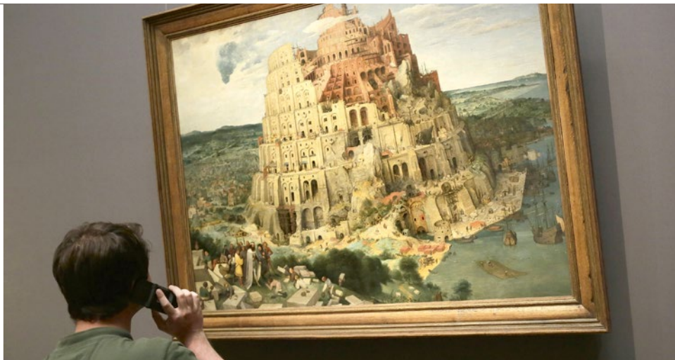
Zum 450. Todestag des flämischen Malers Pieter Bruegel gibt es einige Veranstaltungen in Flandern