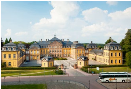
Das im Barockstil gebaute Residenzschloss Arolsen

Die documenta-Stadt Kassel ist das perfekte Reiseziel für alle, die sich Kunst und Kultur verschrieben haben. Im der prämierten GRIMMWELT wird Leben und Werk der Brüder Grimm auf interaktive und moderne Weise erlebbar gemacht. Nicht weit entfernt liegt die barocke Karlsaue mit ihren Teichen, Skulpturen und breiten Alleen. Führungen durch die historische Parkanlage bieten Einblick in das höfische Leben früherer Zeiten. Weiteres Highlight sind die berühmten Wasserspiele im Bergpark Wilhelmshöhe, der zum UNESCO-Welterbe gehört. Von Mai bis Oktober ist an jedem Mittwoch, Sonntag und an hessischen Feiertagen zu erleben, wie sich das Wasser seinen Weg über spektakuläre Kaskaden, Fontänen und Aquädukte hinab ins Tal bahnt. Wer Kassel im Dezember besucht, kommt in den Genuss des einzigartigen