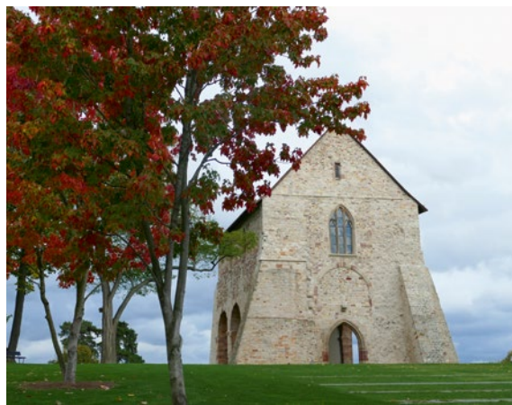
Überarbeitetes Basilikafragment des Klosters Lorsch

Das umfassende Jahresprogramm des UNESCO Welterbes Kloster Lorsch bietet für jedes Interesse und Zeitbudget etwas.