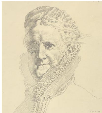
Werner Tübke, Die Dostojewskaja, 1979

Halt. Nach Momenten der Irritation erkennt man in der Vielzahl der Motive Bekanntes, schon einmal Gesehenes. Man taucht ein in eine zeitferne Welt, begibt sich auf eine Reise in die Vergangenheit.