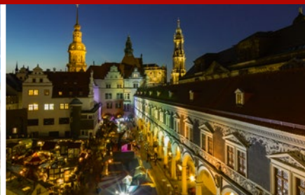
Romantischer Weihnachtsmarkt im Stallhof

Ein Königreich für einen Ausflug im Schlösserland Sachsen. Gehen Sie auf Tagestour durch Sachsens schönste Schlösser.