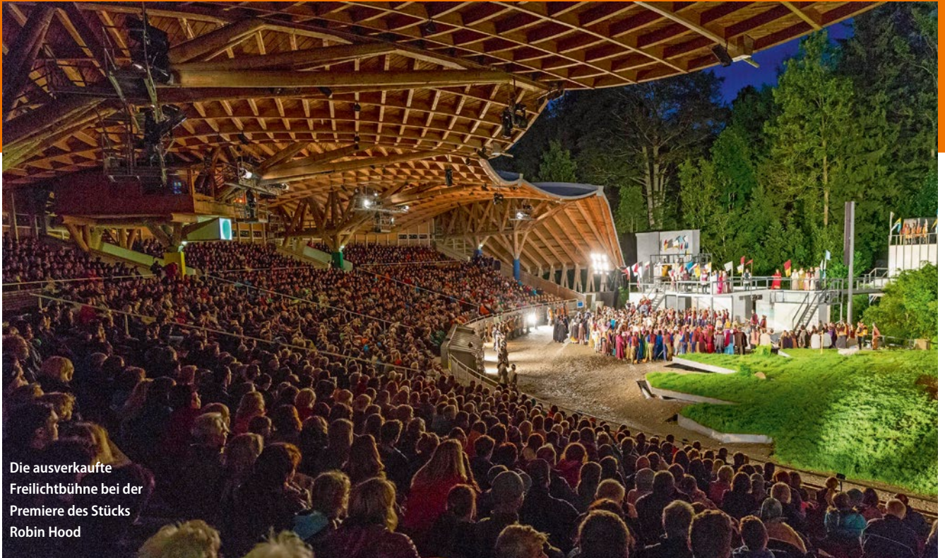
Die ausverkaufte Freilichtbühne bei der Premiere des Stücks Robin Hood

Die Allgäuer Freilichtbühne haucht dem sagenumwobenen König neues Leben ein.