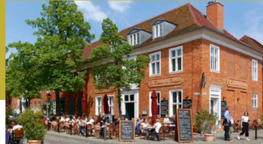
Holländisches Viertel (o.), Schloss Sanssouci (u.)