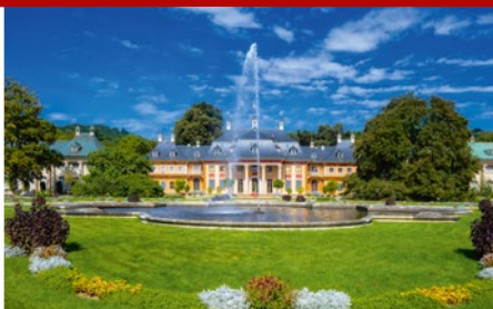
Schloss &amp; Park Pillnitz ist im Elbtal eingebettet