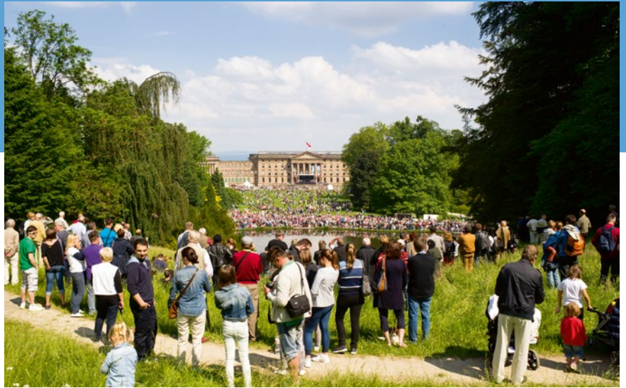
Der Bergpark Wilhelmshöhe in Kassel ist UNESCO-Welterbe

E in abwechslungsreiches Freizeitangebot macht Nordhessen zum idealen Ziel für Gruppenreisen. Neben über 180 individuellen Reiseangeboten für Gruppen enthält der Gruppenreisekatalog der GrimmHeimat NordHessen Vorschläge für spannende Reiserouten, von Tagestouren über dreitägige Kurztrips bis hin zu abwechslungsreichen Sechstage-Touren.