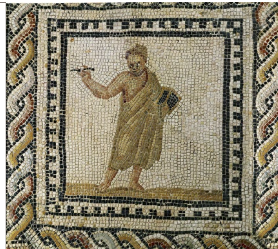
Römische Kunst im rheinhessischen Landesmuseum Trier