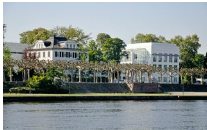
Das Museum Angewandte Kunst